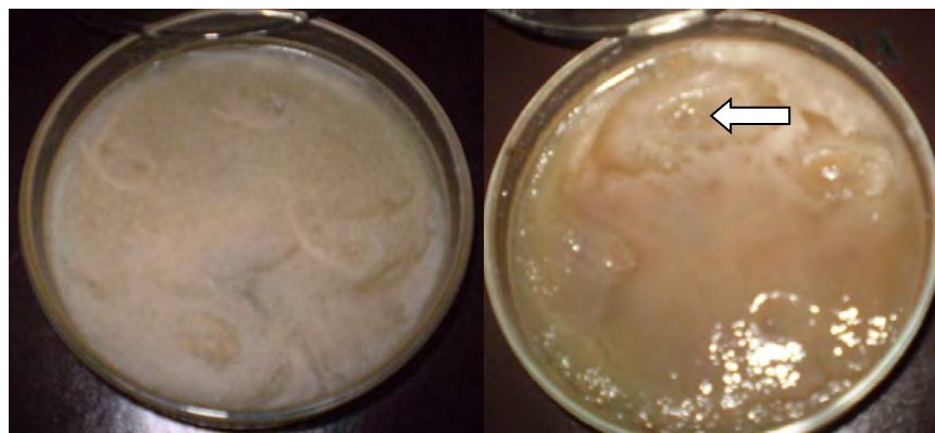
Figura 1. Crecimiento de microorganismos que constituyen los principios activos de biofertilizantes en presencia del Fitomas E a una concentración de 2,5%. Derecha: BACFOS (la flecha indica la zona de inhibición). Izquierda: BIOBAC.

La aplicación de los biofertilizantes no provocó el mismo efecto sobre la germinación de semillas de lechuga. El producto DIMAZOS inhibió el índice y el Porcentaje de germinación para 'Fomento 95' (Tabla 3), mientras que el FIXOL y el BIOBAC mostraron ese efecto para el Índice de vigor en el caso del cultivar 'Chile 1855-3' (Tabla 4), por lo que se puede afirmar