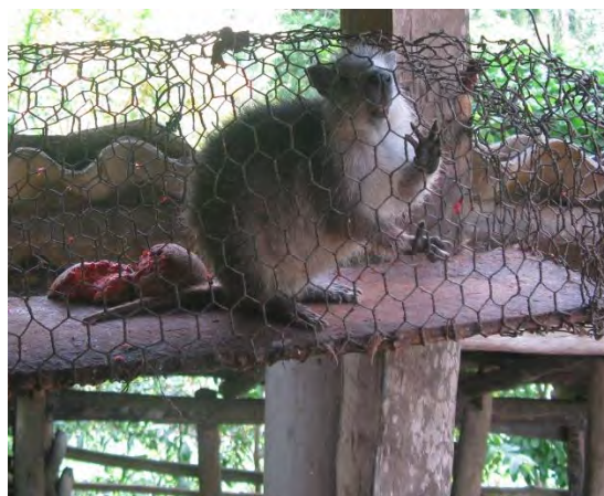
Figura 2: Jutía conga ( Capromys pilorides )