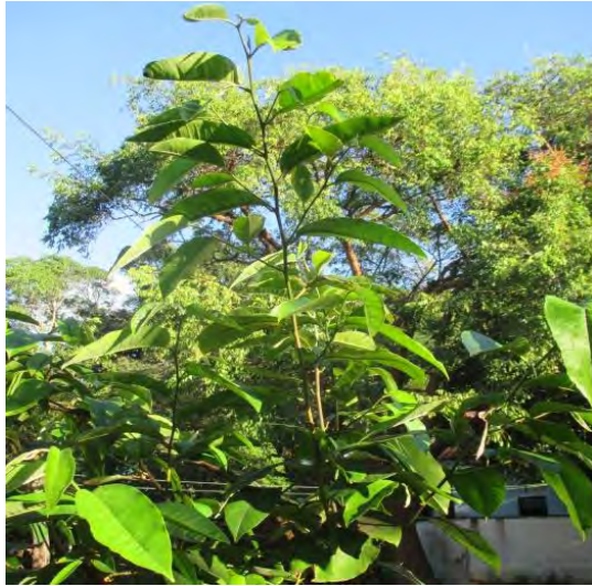
Figura 3. Rama de Chrysophyllum argenteum