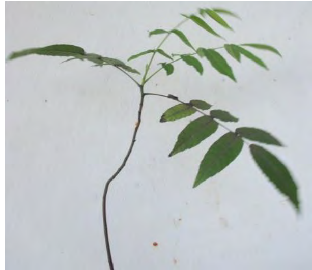
Figura 4. Plántula de Nogal del País ( Juglans jamaicensis )