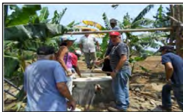
Laboreo con tracción animal