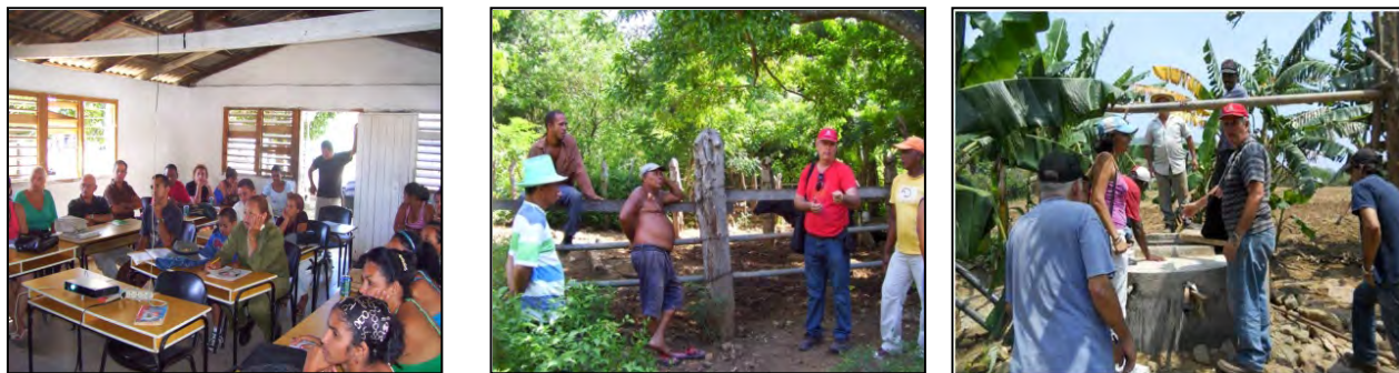
Figura 2. Intercambio y retroalimentación con los actores involucrados

la dirección del Consejo Popular Madrugón, cuya participación fue el más importante recurso para el desarrollo del proyecto (Figura 2).