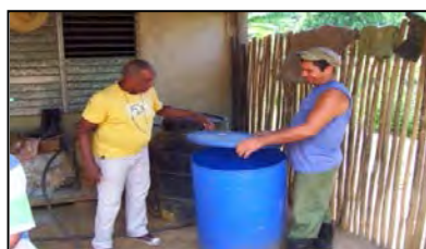
Instalación de ariete hidráulico