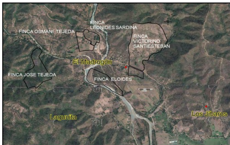
Figura 1. Fincas seleccionadas del Consejo Popular Madrugón. Guamá. Santiago de Cuba.

Se delimitaron las áreas ocupadas por las fincas y fueron estudiadas por separadas, en cuanto al inventario físico de sus tierras, estado de conservación de los suelos y su potencial agro productivo. Además se identificaron los intereses y las necesidades de integración vinculadas al desarrollo y empleo de técnicas agroecológicas y la transferencia apropiada de tecnologías, incluyendo de manera especial el uso racional de las fuentes renovables de energía y la aplicación de medidas de protección del medio ambiente.