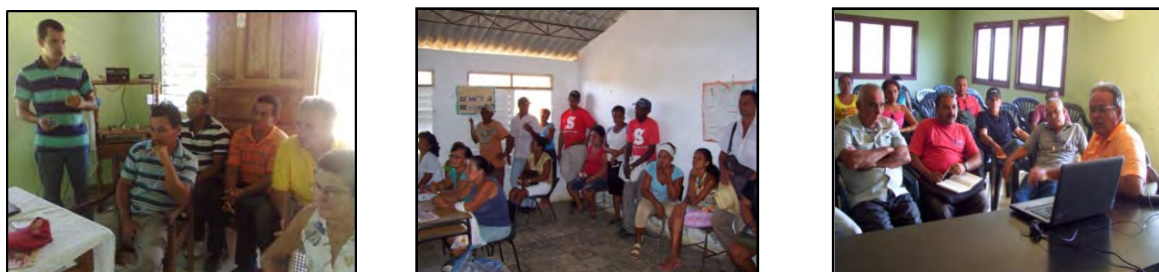
Figura 4. Actividades de capacitación con campesinos y actores locales