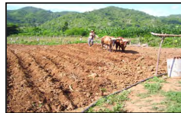
Riego que aumenta la productividad