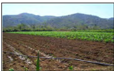
Pozo de agua subterránea

Costeras. CEMZOC. Universidad de Oriente.