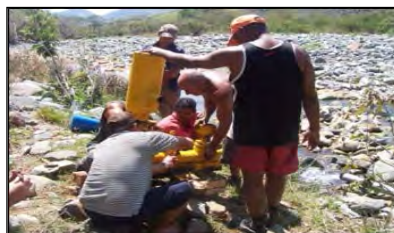
Preparación del biodigestor