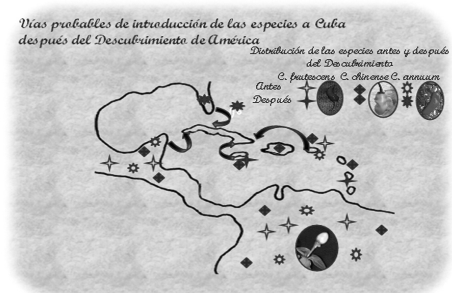
Figura 1. Posibles rutas migratorias de las especies de Capsicum hacia Cuba