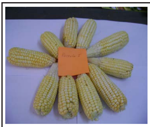
Figura 5. Mazorcas de Maíz de la parcela I