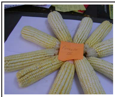
Figura 4. Mazorcas de Maíz de la parcela III