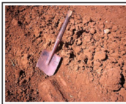
Figura 2. Presencia de piso de arado cerca de la superficie del suelo

Otro aspecto de interés es la estructura de bloques prismáticos y la poca porosidad (Figura 3). Al respecto, en la actualidad se le denomina suelos de perfiles agrogénicos que presentan horizontes A-Bt-C, BA-Bt-C ó BA-Bt(pa)-C. Donde Bt(pa) significa que tiene piso de arado en la parte alta del horizonte (Hernández et al. , 2013), debido a una intensa actividad antrópica con el cultivo continuado.