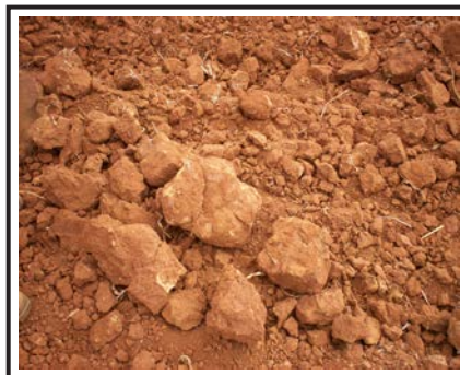
Figura 3. Estructura de bloques prismáticos en el suelo estudiado