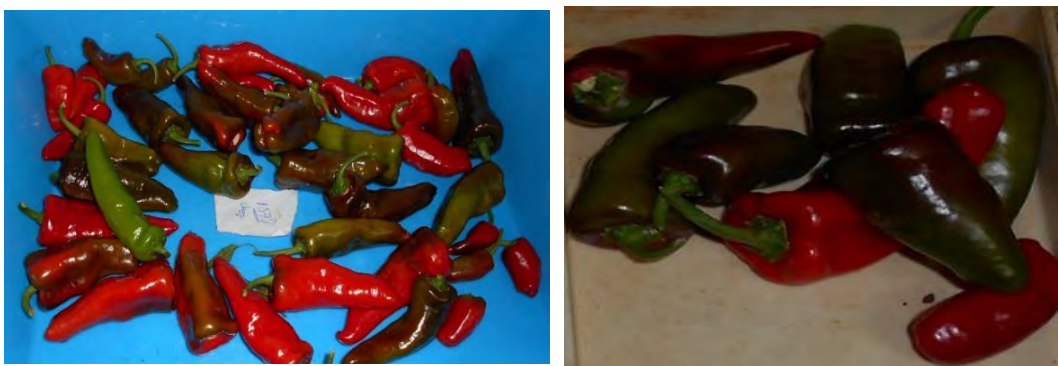
Figura 3. Frutos tipo Chay de las accesiones 'P-1078' y 'P-1777a' respectivamente.