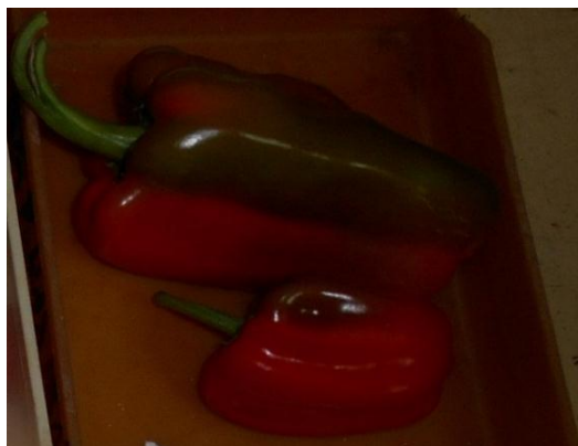
Figura 4. Frutos tipo español de las accesiones 'P-1540' y 'P-1777' respectivamente ( Capsicum annuum ).

Los caracteres grosor del pericarpio, longitud y ancho del fruto manifiestan diferencias significativas entre los grupos. Los caracteres altura de planta, peso del fruto y contenido de sólidos solubles unen a los Grupos I y II, lo cual los diferencia del Grupo III. En el caso del número de semillas por fruto los Grupos II y III se agrupan, pero ambos difieren del Grupo I, el cual tiene un número medio menor de semillas por fruto. Para el peso de 100 semillas se observa un mayor valor en el grupo III por lo que difiere del Grupo I, pero no del Grupo II. El número de flores por axila es superior en el Grupo I y difiere significativamente de los Grupos II y III.