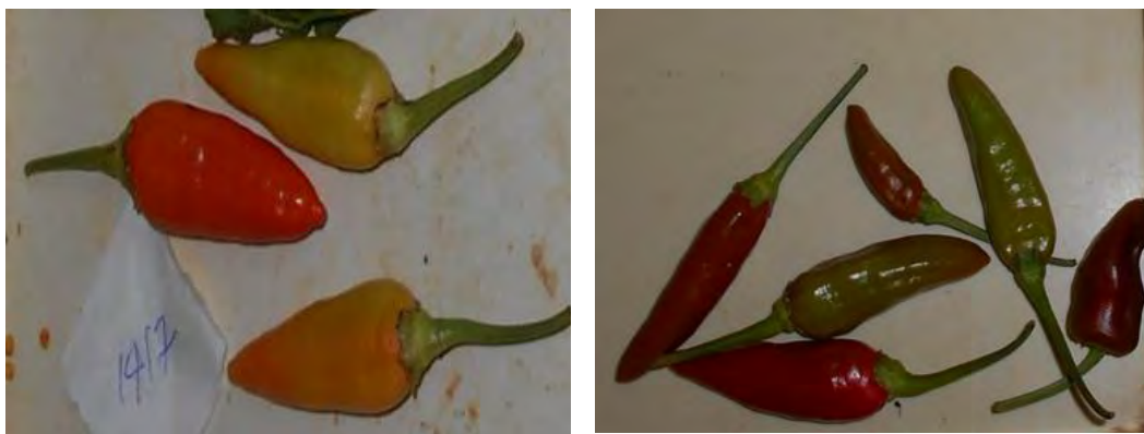
Figura 2. Frutos tipo chile de las accesiones 'P-1417' y 'P-1261' respectivamente ( Capsicum frutescens ).

Se distingue este grupo por una altura media de 78,15 cm intermedia entre los grupos I y III. Un alto valor de coeficiente de variación para el peso medio del fruto (+ 50,0 %). También se observan valores medios que son de naturaleza intermedia entre los grupos I y III, así como niveles de CV elevados superiores al 30 % para la altura de planta, la anchura, el peso del fruto y el número de semillas por fruto. Se destaca en este grupo formas que pueden ser utilizadas como vegetal verde (Figura 3), en conserva y otras que podría considerarse su deshidratación si se considera su alto contenido de sólidos solubles totales.