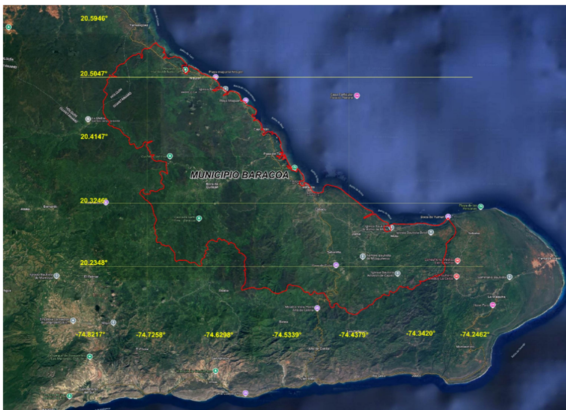
Figura 1. Ubicación geográfica del municipio Baracoa

El trabajo de cartografía de los suelos y de otros componentes, se realizó de forma automatizada con el programa del Sistema de Información Geográfica QGIS, versión 3.14, lo que facilita el uso posterior de la información contenida en archivos del SIG, al mismo tiempo que la misma puede continuar su actualización y ampliación, de acuerdo con las necesidades que se presenten.